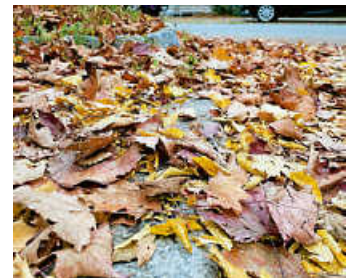
Nasses Laub auf Wegen erhöht die Rutschgefahr.