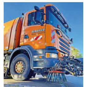
Vom 10. bis 14.11. erfolgt die Straßenreinigung in Uchingen.